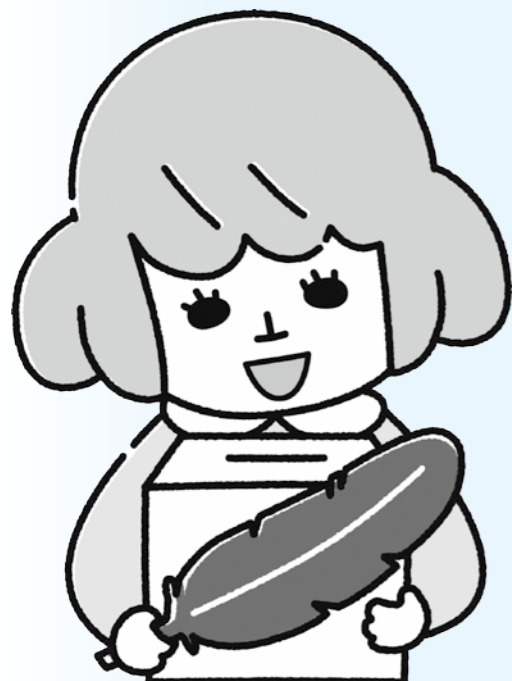
あかはねちゃん

赤い羽根共同募金は、「じぶんのまちを良くするしくみ」として、町内の様々な福祉の課題に取り組むために活用されています。