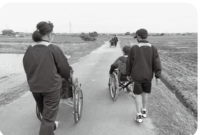
▲車いす体験 いつもの道も車いすから見ると違って見えますね