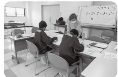
▲点訳体験 点訳サークルすみれの指導のもと絵本に点字をつけました