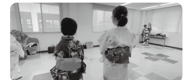
▲着付け体験 とても可愛く着付けることができましたね😊

■オープンからえ 原則毎月第2金曜日 10時~11時 障害者ふれあいセンター フリードリンク100円 ■善意銀行 随時 福社会費 毎年6月 共同募金 毎年10月1日~12月31日 歳末助け合い募金 毎年12月 いつもあたたかいご協力ありがとうございます