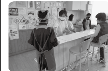
▲喫茶体験 喫茶ボランティアや地域の方と交流しました