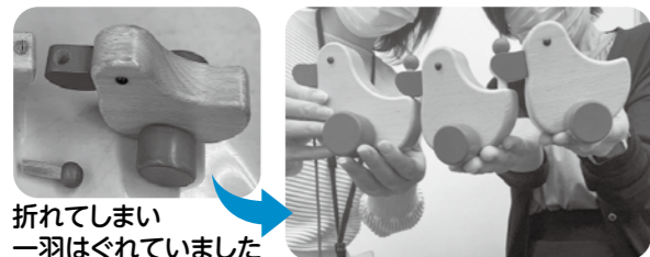
折れてしまい一羽はぐれていました

ボランティアグループ「おもちゃライブラリー」の活動内で使用するおもちゃを修理していただきました。依頼の翌日には修理されて戻ってきて、あまりの早い対応におもちゃライブラリーのスタッフも大変喜ばれていました。