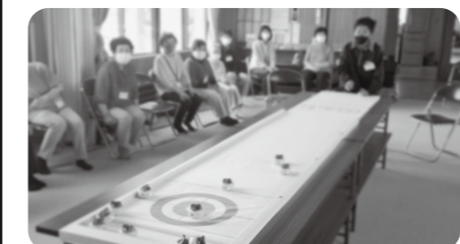
▲ニューススポーツ体験 十七丁サロンの皆様ありがとうございました!