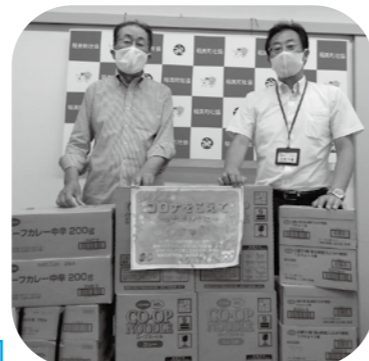
▲①生活協同組合コープこうべ様より (R2.9.1)

VOICE あたたかいご寄附をいただき、ありがとうございます。 ※①新型コロナウイルス特例貸付に借入申込された世帯に配分させていただきます。 ※②社会福祉法人こぼと会こぼと園へ払い出しさせていただきました。