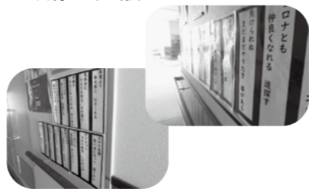
まだまだ募集中です!!