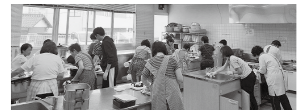
▲給食ボランティアの皆さんと調理室の清掃(生きがい創造センター R1.8.28)

稲美町社会福祉協議会での実習を通して、様々な活動に参加・同行させていただき、机上では学ぶことのできない貴重な体験をすることができました。稲美町の住民の方たちはあたたかい方たちばかりで、活動に快く受け入れてくださったり、「実習頑張ってるね」と心優しい声掛けをいただくことでとても元気をもらいました。この実習で学んだことを活かし、今後も社会福祉士の資格を取ることができるよう勉強に励みたいと思います。