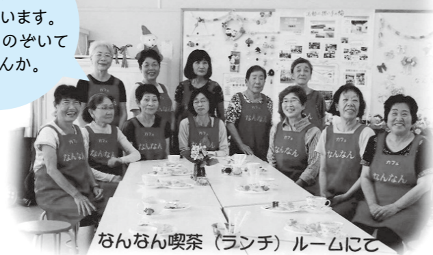
なんなん喫茶(ランチ)ルームにて