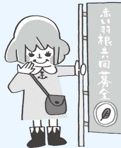
兵庫県共同募金会マスコットあかはねちゃん