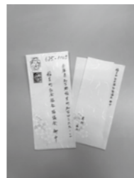
▲①匿名で届きました。ありがとうございました。(R6.2.15)